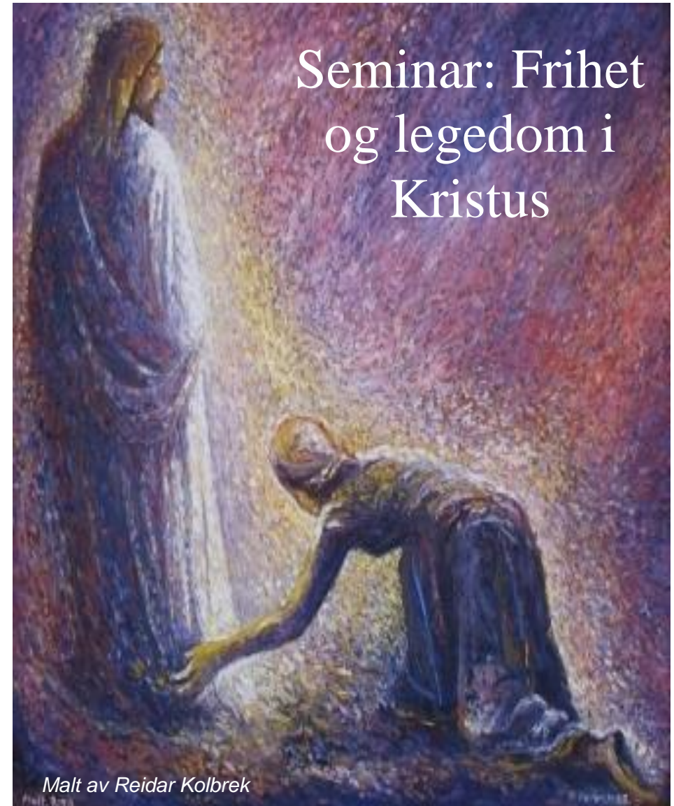
Malt av Reidar Kolbrek